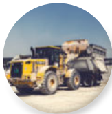
Maquinaria de construcción