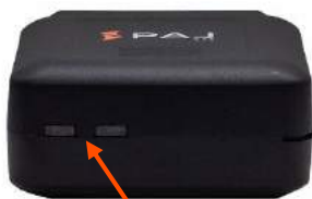
Luci a LED